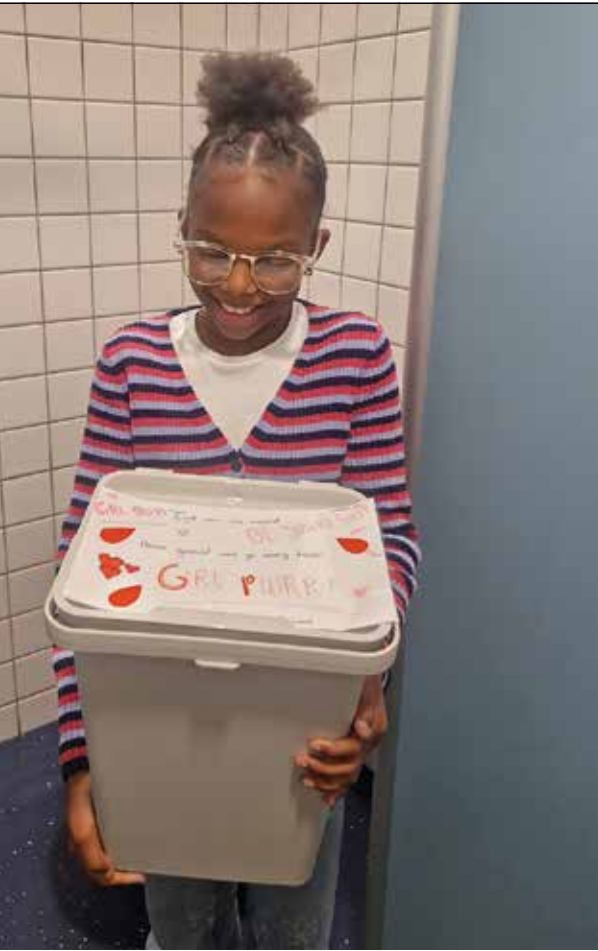
Op zo'n 300 Rotterdamse scholen worden uitgiftepunten ingericht.

hebben we een plek ingericht waar de pakketjes liggen en voor obs Bloemhof heb ik een mandje gekocht, dat bij het lokaal van de bibliotheek ligt. Youyou spreekt soms ook moeders aan van wie ze weet dat ze de pakketjes ook thuis kunnen gebruiken. 'Dan geef ik er een paar mee. Niet alleen voor de dochter, maar ook voor de moeder.'