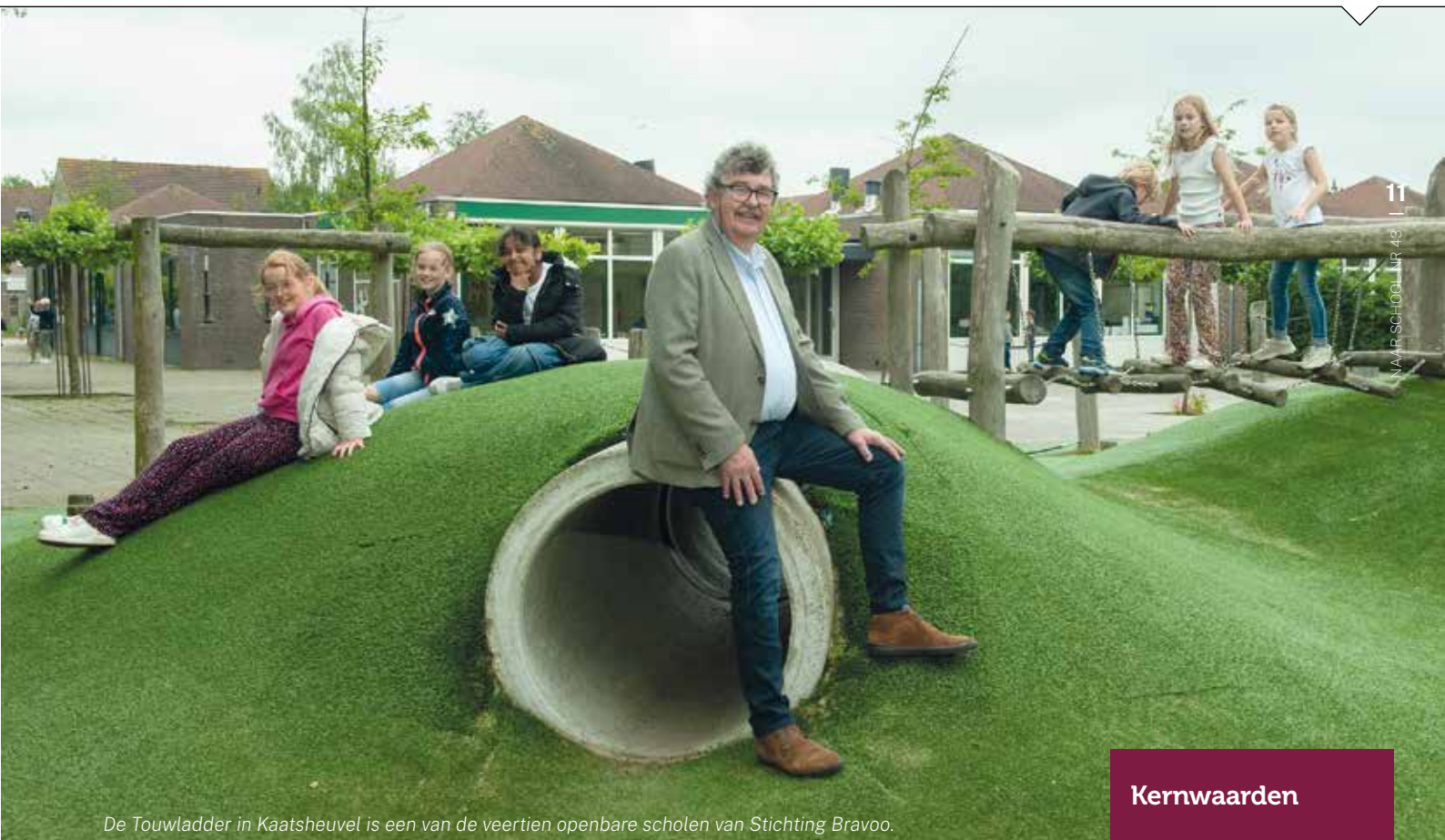
De Touwladder in Kaatsheuvel is een van de veertien openbare scholen van Stichting Bravoo.